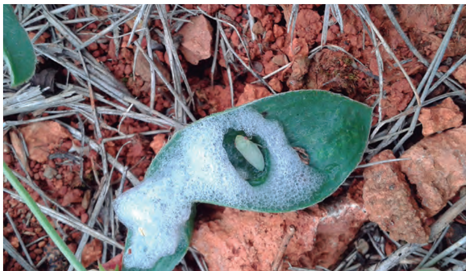
FIGURA 4. Escuma o mucíl·lag produït per les nimfes de Philaenus spumarius que té un efecte protector