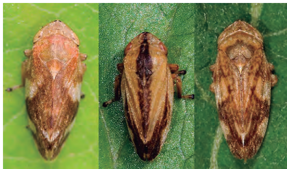
FIGURA 3. Exemplars adults de Philaenus spumarius, en els quals es pot observar la seva variada coloració