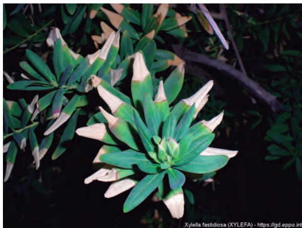
FIGURA 1. Polygala myrtifolia afectada per Xylella fastidiosa

Xylella fastidiosa és un bacteri gramnegatiu de creixement exclusiu en el xilema de les plantes. En multiplicar-se en l'interior dels vasos de la planta pot obstruir el flux de saba bruta —composta, principalment, d'aigua i de sals minerals. Els símptomes varien d'unes plantes hoste a unes altres. En alguns casos es corresponen amb els símptomes típics d'estrès hídric: pansiment o decaïment generalitzat i, en casos més greus, l'assecament de fulles i de branques, i finalment la mort de la planta. En altres casos, els símptomes es corresponen més amb els provocats per deficiències de minerals, com la clorosi internervial o el clapejat en fulles.