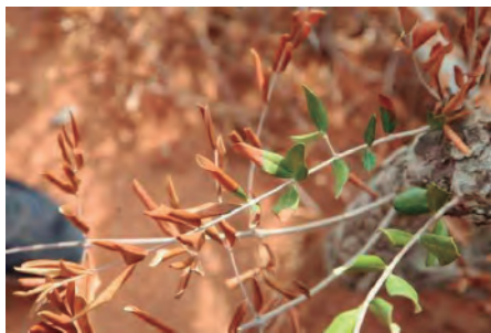
FIGURA 2. Brot d'olivera afectat per Xylella fastidiosa