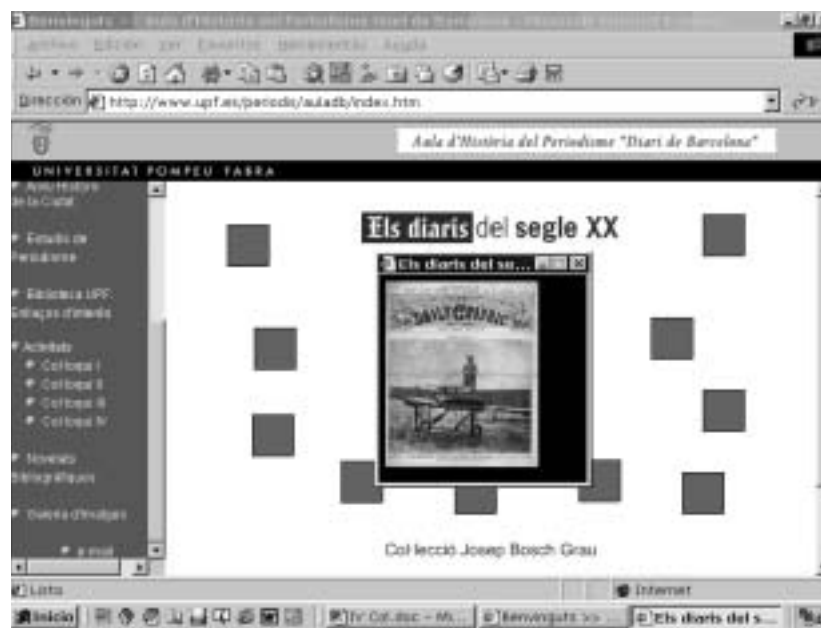
Figura 3. Una part de la galeria d'imatges de la web de l'Aula d'Història del Periodisme.

La web de l'Aula d'Història del Periodisme té l'objectiu de proporcionar informació sobre les activitats principals de l'Aula i de temes d'història del periodisme.