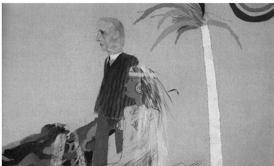
FIGURA 1. Marriage , David Hockney, 1965.