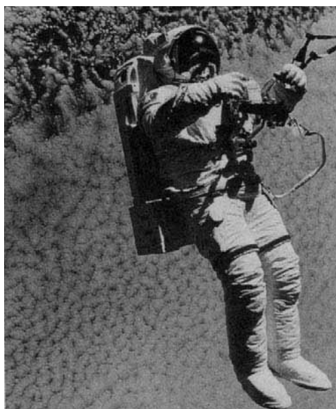
FIGURA 2. Astronauta, imatge de diari.