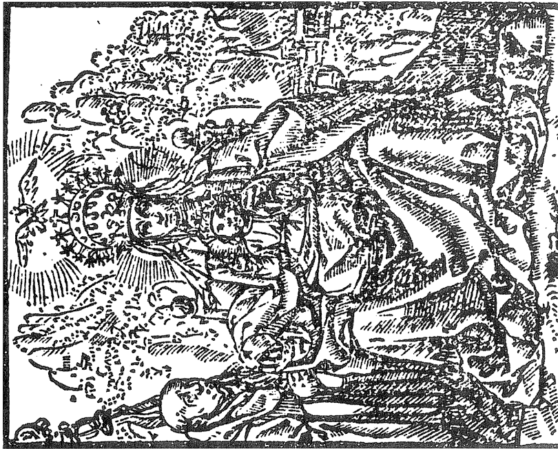
La Santa Imatge de Montserrat abillada amb la corona d'or i maragdes anomenada «hermosa» (cf. Inv. 1641, 114), segons una xilografia gravada l'any 1632; i duent la corona d'or, perles i diamants anomenada «imperial» (cf. Inv. 1641, 115), en un quadre pintat vers l'any 1639.