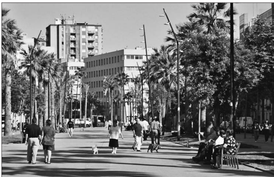
Vista de la rambla del Raval, juny de 2002.