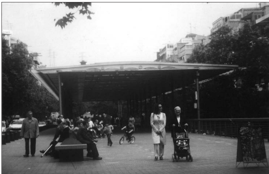
Vista de la Via Júlia, octubre de 2000.