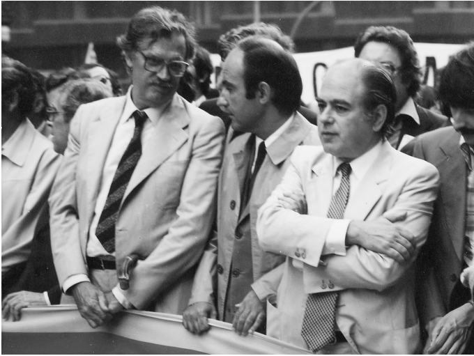
Jordi Pujol, Miquel Roca i Ramon Trias a la manifestació de l'11 de setembre de 1977, amb motiu de la reivindicació de l'Estatut d'autonomia.