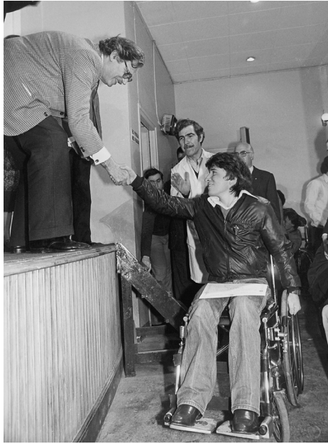
En un acte dedicat a les persones discapacitades.