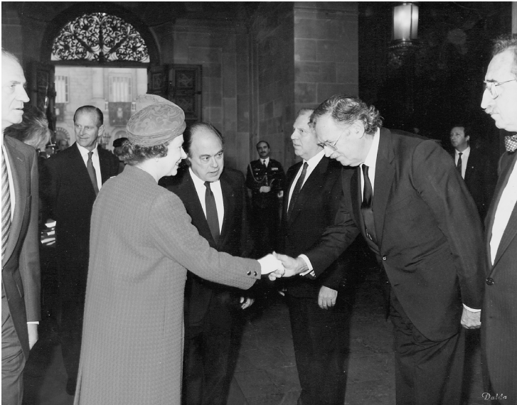
Visita oficial de la reina Isabel d'Anglaterra al Palau de la Generalitat, el 21 d'octubre de 1988.