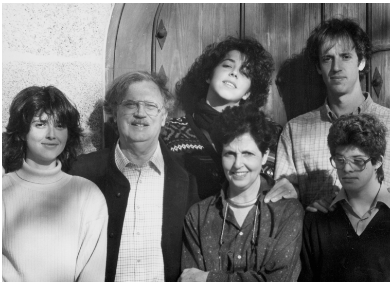
Amb la seva esposa i el seus fills, el 1988.