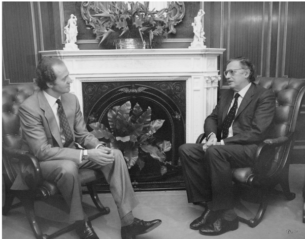
Entrevista amb el rei Joan Carles I al Palauet Albéniz, el 16 de maig de 1985.