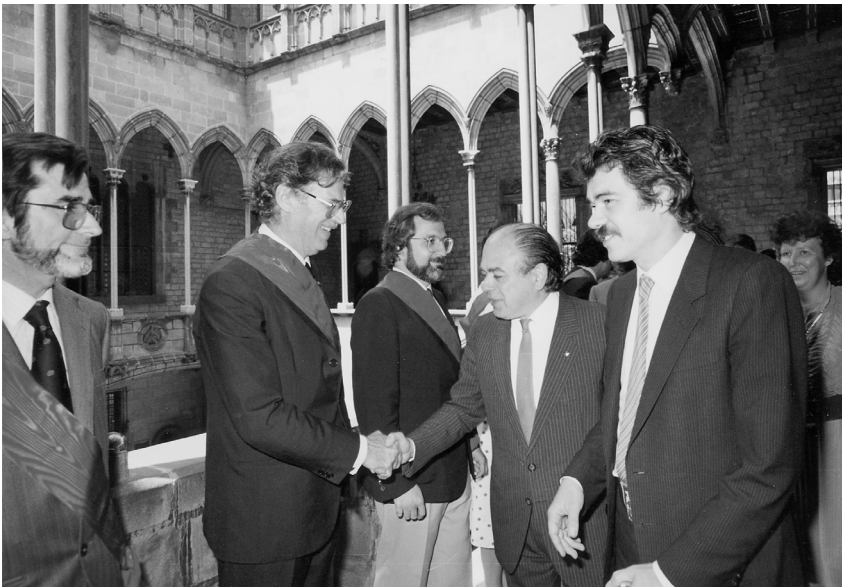
Ple de l'Ajuntament de Barcelona del 7 de juny de 1983.