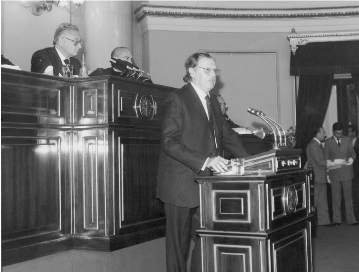
Intervenció al Senat del Parlament espanyol, l'1 d'octubre de 1986.