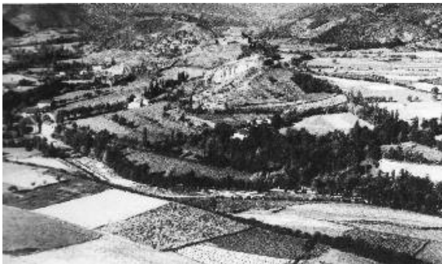
Paisatge agrari de policonreu al terme de Castellciutat.