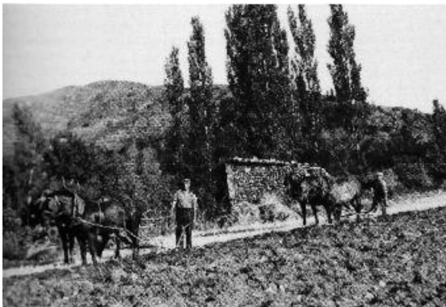
Conreus de secà i eines agrícoles a l'Urgellet.