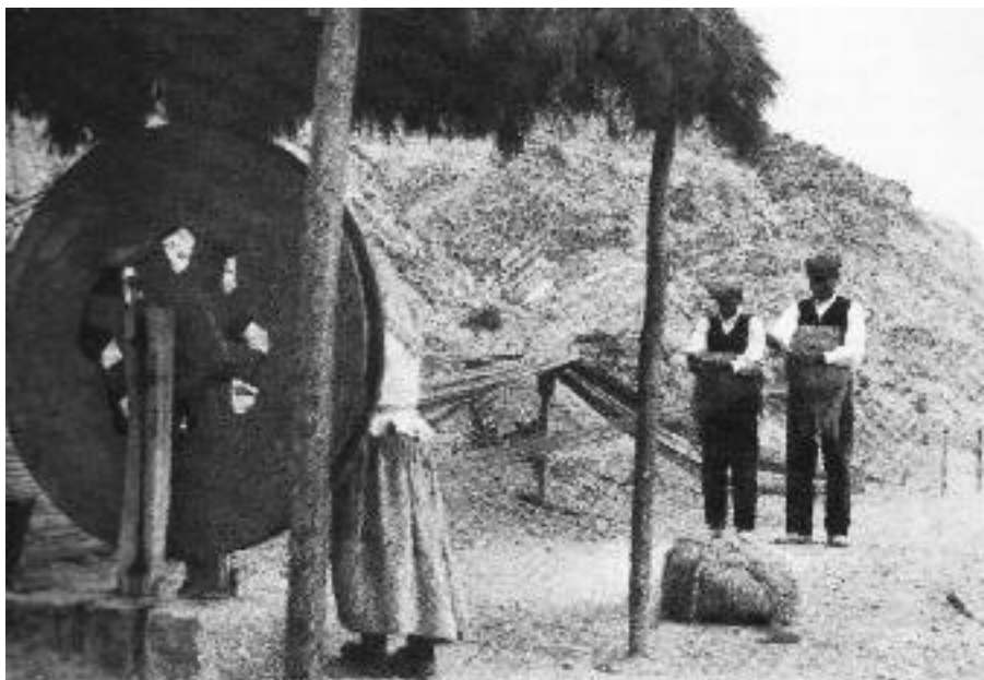
Treball amb el cànem per a la fabricació de cordes.