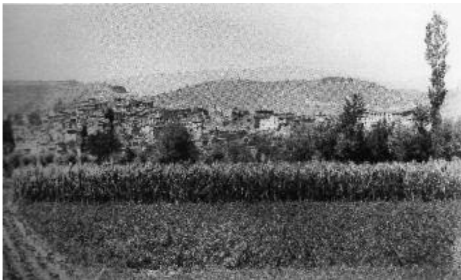
Conreus de regadiu al terme de Castellciutat.