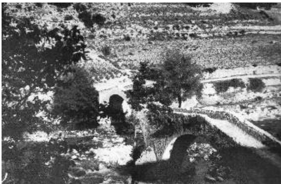
Conreus de vinya al costat del riu Segre.