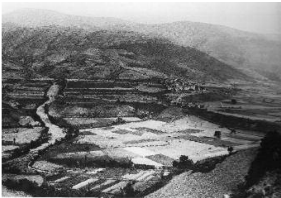
Paisatge agrari de l'Urgellet al Pla de Sant Tirs a final del segle XIX. Autor Lluís Marià Vidal. Fons Arxiu fotogràfic del Centre Excursionista de Catalunya.