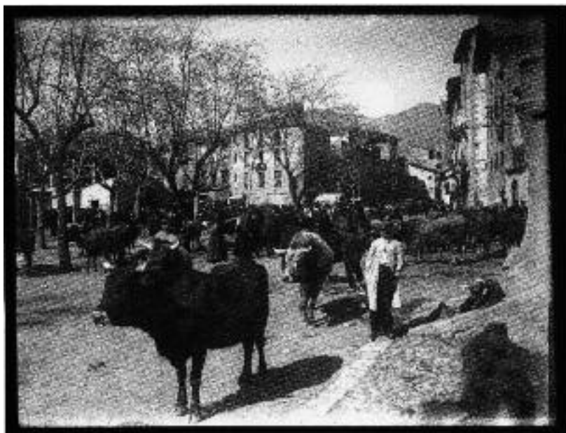
Fira de bestiar al passeig de la Seu cap al 1890. Fons Guillem Plandolit.

Autor Lluís Marià Vidal. Fons Centre Excursionista de Catalunya.