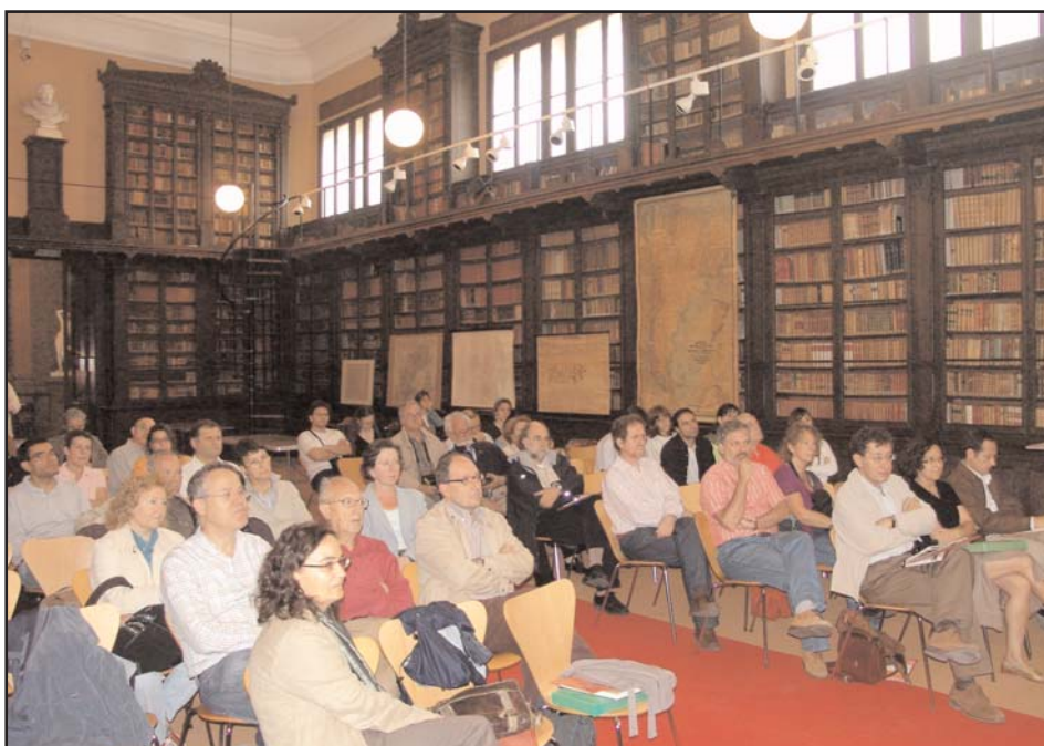
Els congressistes gairebé emplenaren la sala d'actes de la Biblioteca Museu Víctor Balaguer, on s'havia disposat una mostra del fons cartogràfic d'aquesta institució, inventariat per l'Institut Cartogràfic de Catalunya.