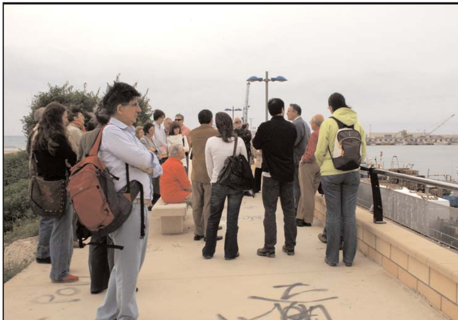
Visita al port de Vilanova i la Geltrú el dissabte 31 de maig