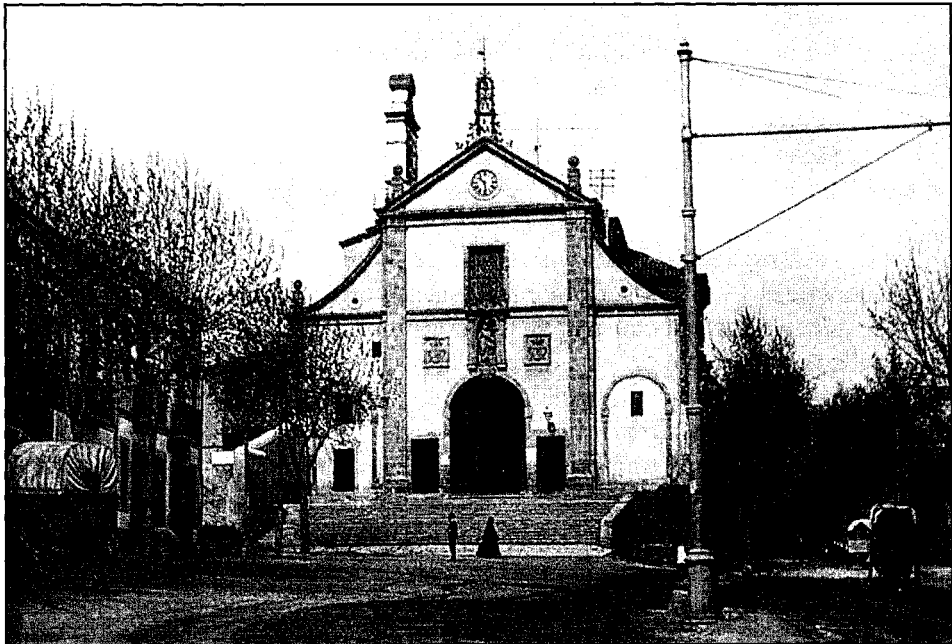
Plaça dels Josepets, any 1905.