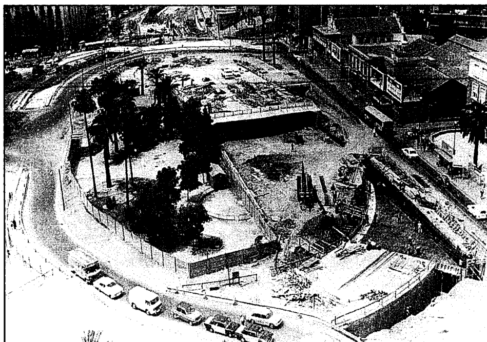
Obres de construcció de la Ronda del General Mitre, l'any 1976.