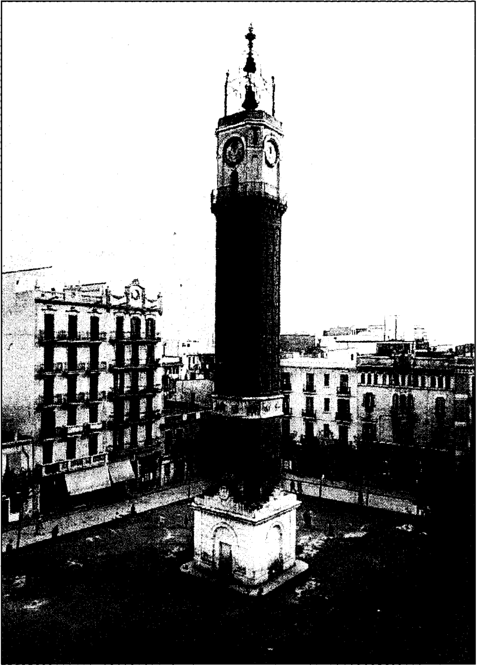
Una imatge del campanar, a la plaça Rius i Tauler, segons una fotografia de la primera del segle xx.