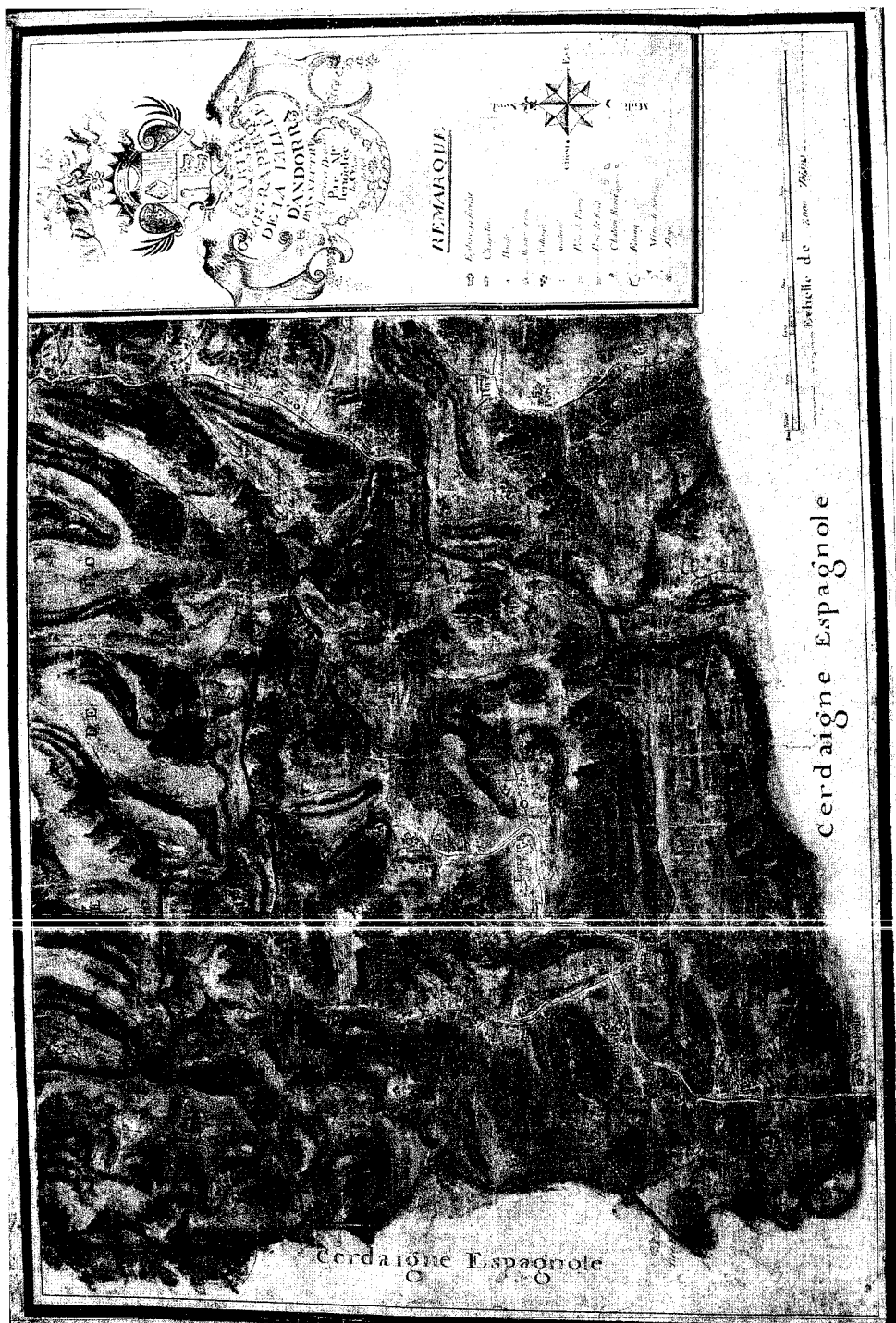
ANDORRA/1777.-CARTE GÉOGRAPHIQUE DE LA VALLÉE D'ANDORRA Pays Neutre Levée et Dissiné par Mr. Lengelée Ing. Geographe du Roi.- Andorra: Mapa Topogràfic d'Andorra.- Esc. [1:60.000].- 1 mapa: col.; 55,5x84,5cm. (orig. AHN)