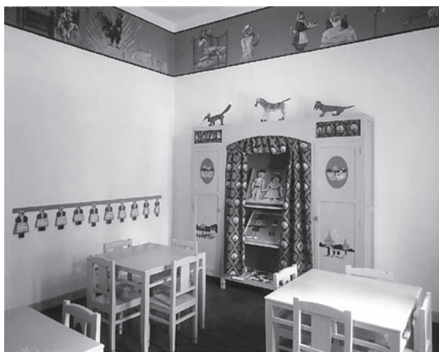
Fotografia nº 4

Grup d'escolars de diferents edats d'Astúries. Fotògraf: Feliciano Pardo, cap a 1910. Museu del Poble d'Astúries.