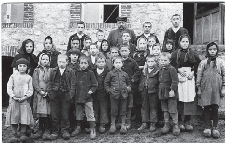
Fotografia nº 10

Nens d'una colònia escolar madrilenya a la platja de Gijón, 23 d'agost de 1932. Fotògraf: Constantino Suárez. Museu del Poble d'Astúries.