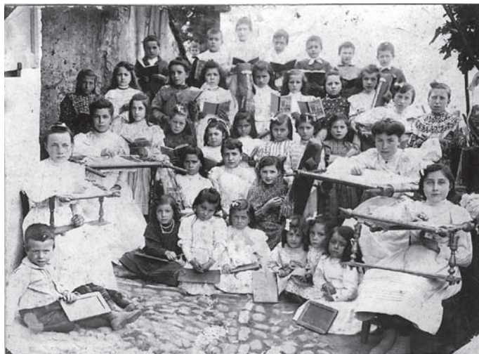
Fotografia nº 3

Grup d'escolars de diferents edats d'Astúries. Fotògraf: Feliciano Pardo, cap a 1910. Museu del Poble d'Astúries.