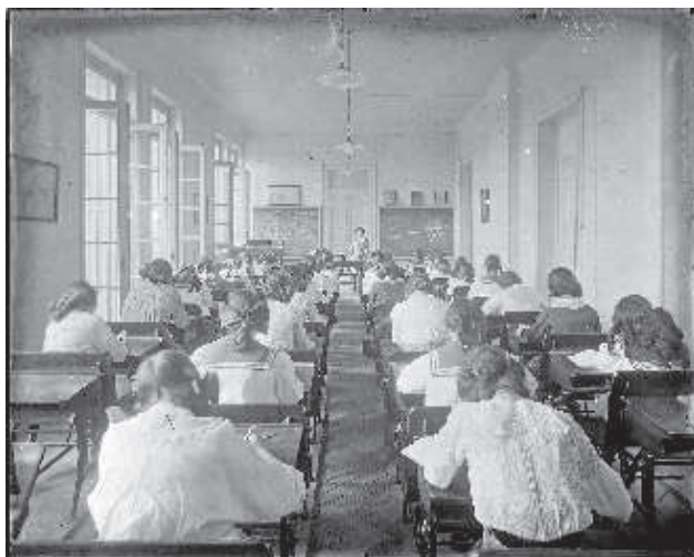
Fotografia nº 5

Una classe de l'Institut Internacional de Senyoretas, Madrid. cap a 1912-1915.