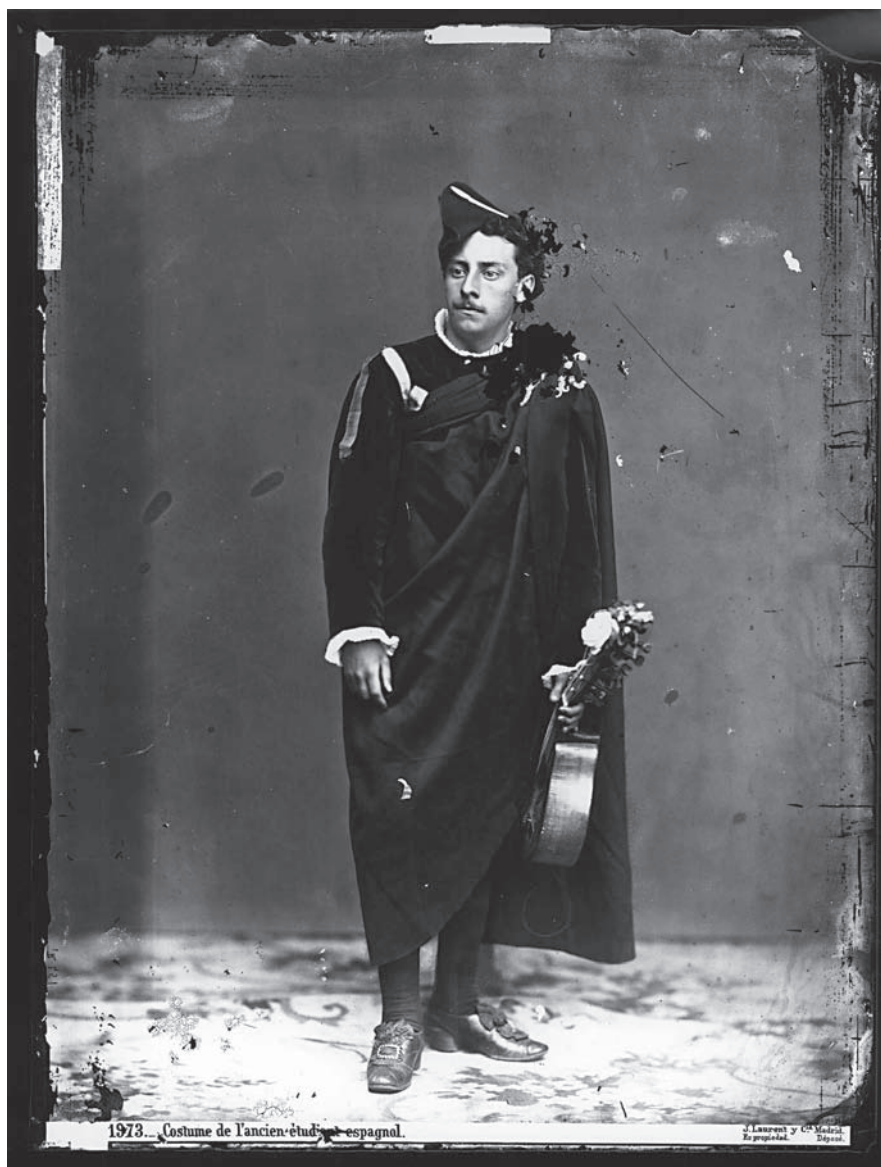
Fotografia nº 2

Costume de l'ancien étudiant espagnol. Fotògraf: J. Laurent, cap a 1862. Arxiu Ruiz Vernacci, IPCE, Ministeri de Cultura.