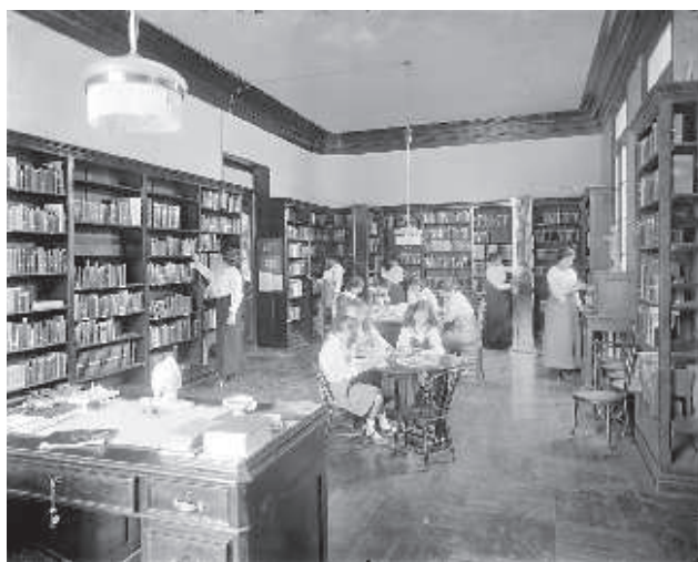
Fotografia nº 6

Una classe de l'Institut Internacional de Senyoretas, Madrid. Fotògraf: Mariano Moreno, cap a 1912-1915. Arxiu Moreno, IPCE, Ministeri de Cultura.