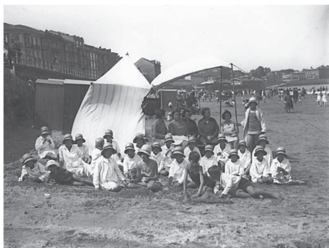
Fotografia nº 8

Fotografia: Mariano Moreno, entre 1912-1915. Arxiu Moreno, IPCE, Ministeri de Cultura.