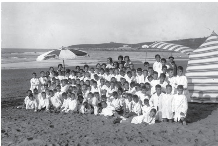
Fotografia nº 9

Nens d'una colònia escolar madrilenya a la platja de Gijón, 23 d'agost de 1932.