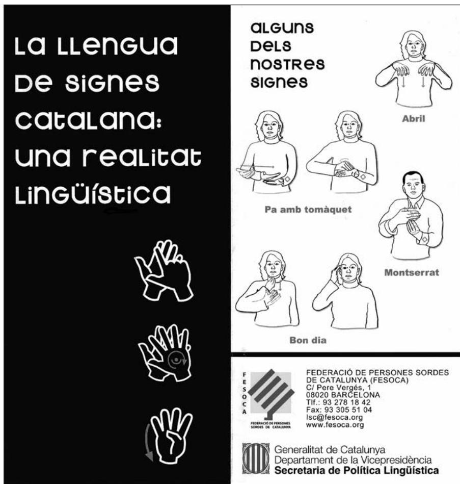
FIGURA 5. Tríptic informatiu sobre la LSC

Finalment, la FESOCA, amb el suport de la Secretaria de Política Lingüística de la Generalitat de Catalunya, va elaborar un tríptic divulgatiu (figura 5), amb l'objectiu d'oferir informació a la societat catalana sobre les característiques lingüístiques de la llengua de signes catalana. El tríptic defineix la LSC com una part important del patrimoni cultural de Catalunya, com una llengua viva que reuneix totes les característiques morfològiques i sintàctiques, tan rica en continguts gramaticals com qualsevol altra llengua oral.