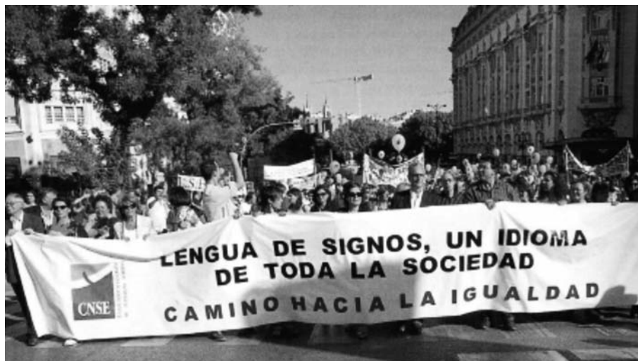
FIGURA 3. Festa celebrada a Madrid el dia 1 d'octubre de 2005, amb motiu del reconeixement oficial de la LSE

L'any 2005, la CNSE va presentar un esborrany de l'Avantprojecte de llei per al reconeixement de la llengua de signes. El 16 de setembre de 2005 el Consell de Ministres va aprovar l'Avantprojecte de llei de la llengua de signes espanyola i també va reconèixer la llengua de signes catalana (figura 3).