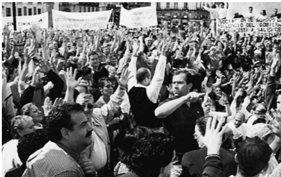
FIGURA 2. Manifestació de la comunitat sorda per a reclamar els drets bàsics

i implantació de llenguatge de signes, així com l'avaluació de les necessitats i les conseqüències que tindria per a les diferents administracions la seva implantació generalitzada».