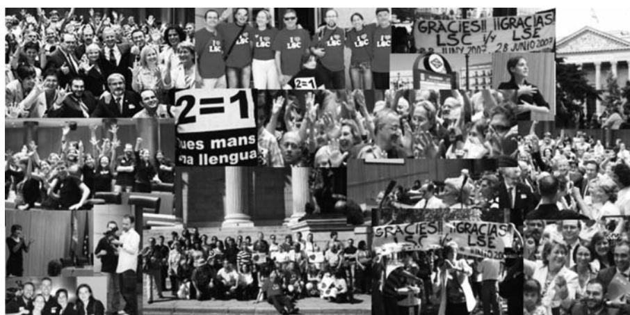
FIGURA 4. Mostres d'alegria per l'aprovació del Projecte de llei al Senat

El 10 d'octubre de 2007, la Cambra del Senat va aprovar el Projecte de llei sense modificacions i amb el text íntegre; per tant, la LSC va ser reconeguda com la llengua pròpia de les persones sordes de Catalunya. Els representants del moviment associatiu a Espanya i Catalunya (CNSE i FESOCA) van manifestar molta alegria per aquest reconeixement (figura 4).