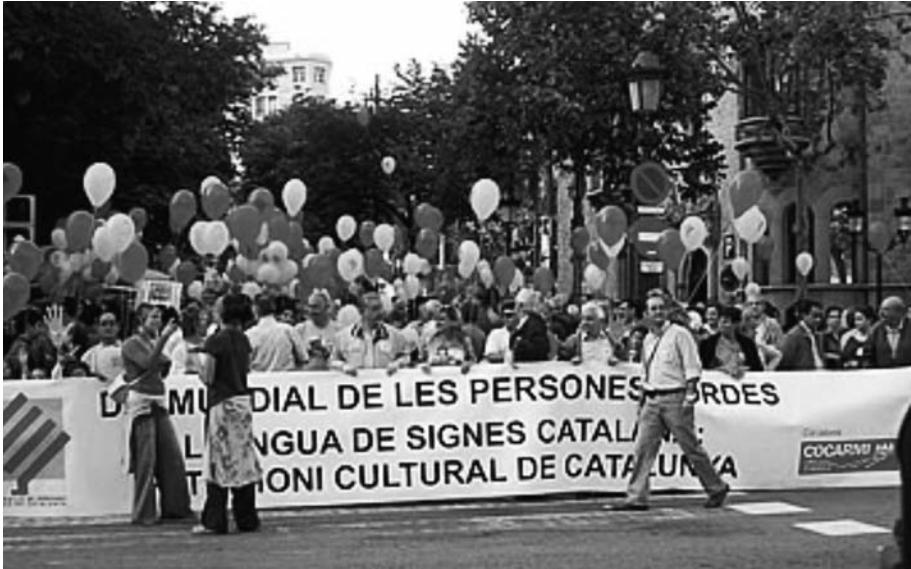
FIGURA 1. Celebració del Dia Mundial de les Persones Sordes

Un altre indicador important de l'estatus d'un grup és la presència dels seus membres en la societat en general. Actualment, es pot dir que les persones sordes quasi no apareixen als mitjans de comunicació ni als centres de decisió de la vida laboral, social i política. No obstant això, sí que va sorgint, entre les persones sordes, un sentiment de capacitat i poder, allunyat de l'actitud passiva que havien mantingut en altres èpoques (figura 2). En aquest aspecte hi contribueix, majoritàriament, la mateixa comunitat sorda, que durant molt anys ha organitzat cursos i jornades de formació amb l'objectiu de conscienciar la societat oient del dret fonamental de què disposa com a ésser humà: utilitzar la llengua pròpia.