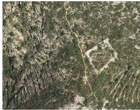
Figura 2. Vista aèria de les restes d'un antic corral situat tocant el traçat del lligallo de la Roca Roja

Així, amb les grans amplades s'aconseguia un trasllat fàcil dels ramats, amb comoditat i facilitat per a la seva conducció. Tot i això, la pastura no