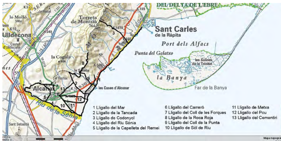
Figura 6. Els lligallos canareus segons la classificació de vies pecuàries de 1961