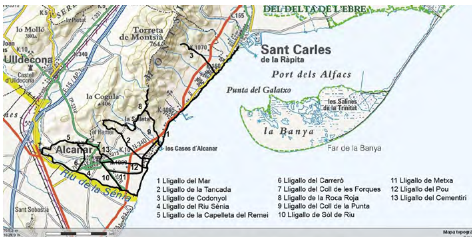
Figura 5. Els lligallos canareus segons la delimitació i fitació de 1930