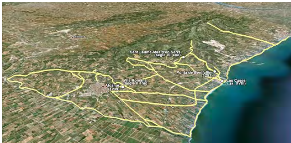
Figura 11. Situació dels nuclis de població més importants del terme d'Alcanar i traçat de tots els lligallos canareus