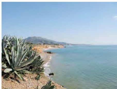
Figura 10. Les timbes de la platja de Sòl de Riu dibuixen el traçat del lligallo del Mar, amb el Montsià al fons

La via pecuària segueix tota la vora de la mar, trobant tot seguit el Descansador i Abeurador de la Granja (ja desaparegut) als voltants de la desembocadura del barranc de la Granja; passa pel far de Sant Carles de la Ràpita, 15 troba pel camí tots els barrancs que des de la serra del Montsià baixen a la mar i també els lligallos de Codonyol, del Coll de la Punta, de la Tancada i del Pou. Traversa les Cases pel que avui és el carrer de Lepant i continua pel passeig marítim del Marjal. Després de passar per l'Estanyet i pel Camaril arriba fins al límit del terme, al riu de la Sénia, on es troba amb el lligallo del mateix nom, a la zona on hi havia l'antic Abeurador del Mar. La seva longitud aproximada és de 12,8 km, incloent la part que actualment està dins el terme municipal de la Ràpita.