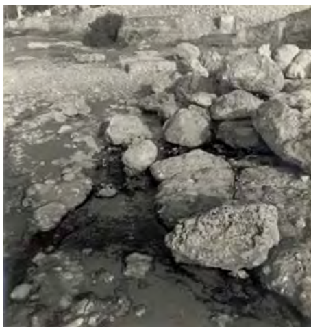
Fotografia de l'any 1960