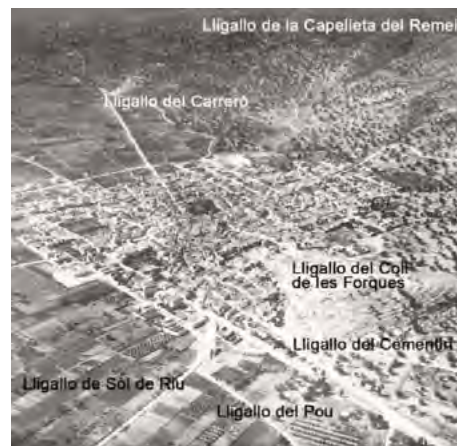
Figura 1. El nucli urbà de l'Alcanar de l'any 1957 i els lligallos que hi confluïen

A l'antiguitat les vies pecuàries ja comencen a constituir una xarxa d'itineraris prou delimitats destinada al trànsit dels ramats. Aquests camins s'utilitzaven per la transhumància del bestiar –especialment oví– que creuaven el país per aprofitar les pastures segons les diferents estacions de l'any. Situades estratègicament, aquestes vies, unien les pastures d'estiu a la muntanya amb les d'hivern a la terra baixa.