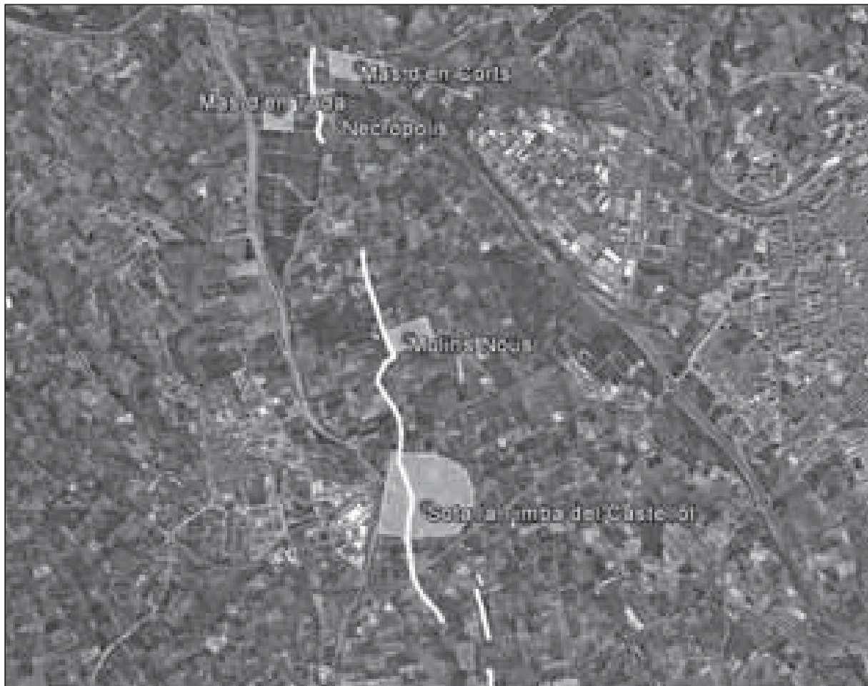
Fig. 3. Traces de sèquia prospectades i àrees dels jaciments romans: terrisseria del Mas d'en Corta, vil·la del Mas d'en Toda, vil·la de Molins Nous, terrisseria i aglomeració de Sota la Timba del Castellot.

pol·líniques. És cert que en el període medieval sorgeix un factor d'evolució nou, que són les parròquies. Al seu voltant s'agrupa part de la població rural. Ara bé, a la llum dels estudis del poblament del PAT, cal pensar que en el període romà també hi havia alguns nuclis o aglomeracions, de moment però, mal coneguts.