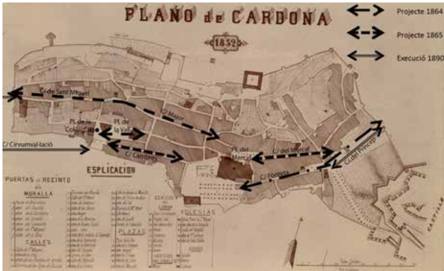
Figura 7. Les alineacions dels carrers de Cardona, 1864, 1865 i 1890