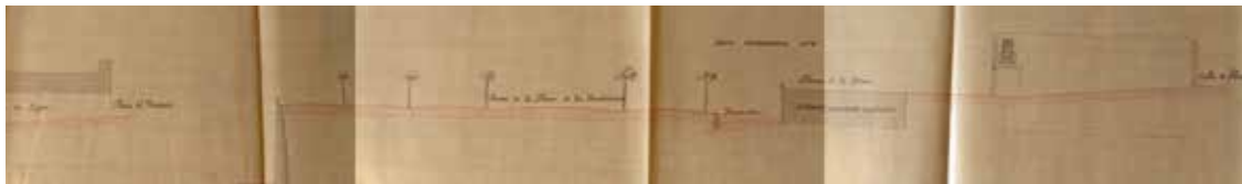
Figura 5. Detall del perfil transversal del carrer Fonteta a escala 1:200