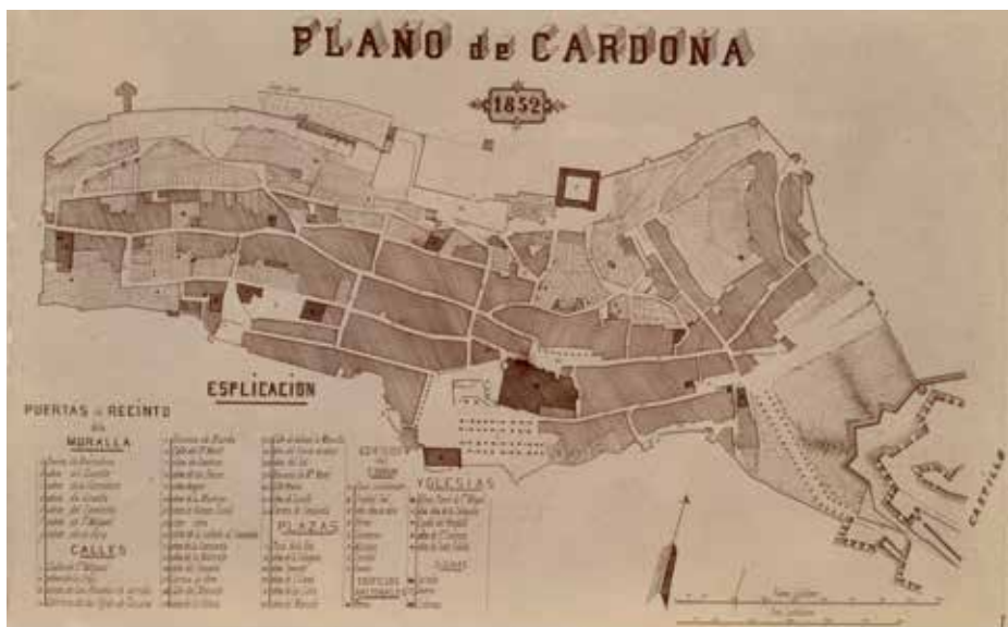
Figura 1. El Plànol de Cardona de 1852

Art.49. Los edificios no podrán contar más de cuatro pisos con el entresuelo, siendo a lo más el total de elevación novena palmos, procurando que las aberturas estén según las reglas del arte y pintando o blanqueando el frontis cuando se haga nuevo, se revoque o modifique [...]» (Ajuntament de Cardona, 1852).