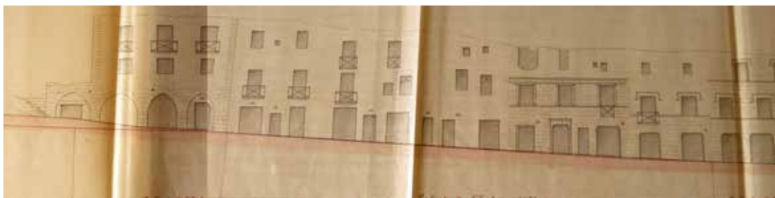
Figura 6. Perfil natural de la vorera dels números parells del carrer de la Fonteta i plaça de les Cols a escala 1:150