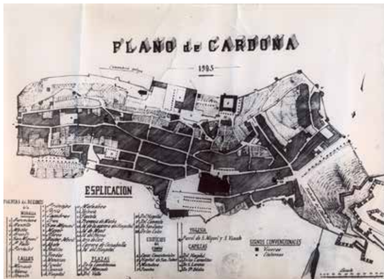
Figura 8. El plànol geomètric de 1905