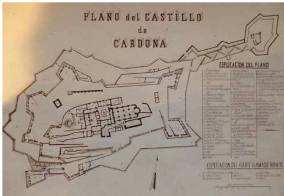
Figura 2. Plànol del castell de Cardona, 1852