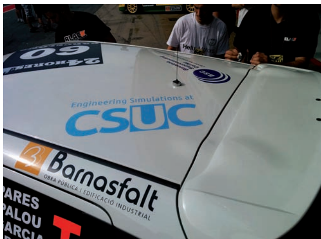
Figura 3: El Nissan Juke, de l'equip Beyond Formula Student (B_FS), durant la seva participació en les 24 hores de resistència a Montmeló.

forma rutinària problemes de classe exaescala equivalents a milions de nuclis de computació en enginyeria i les ciències aplicades.