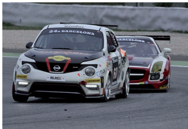
Figura 2: El CSUC ha participat en l'equip B_FS desenvolupant les millores aerodinàmiques usant eines avançades de simulació computacional.

Un altre, que es desenvolupa en les pàgines següents, és el projecte NUMEXAS (Numerical Methods and Tools for Key Exascale Computing Challenges in Engineering and Applied Sciences), que té per objectiu desenvolupar, implementar i validar la següent generació de mètodes numèrics que permetran resoldre de