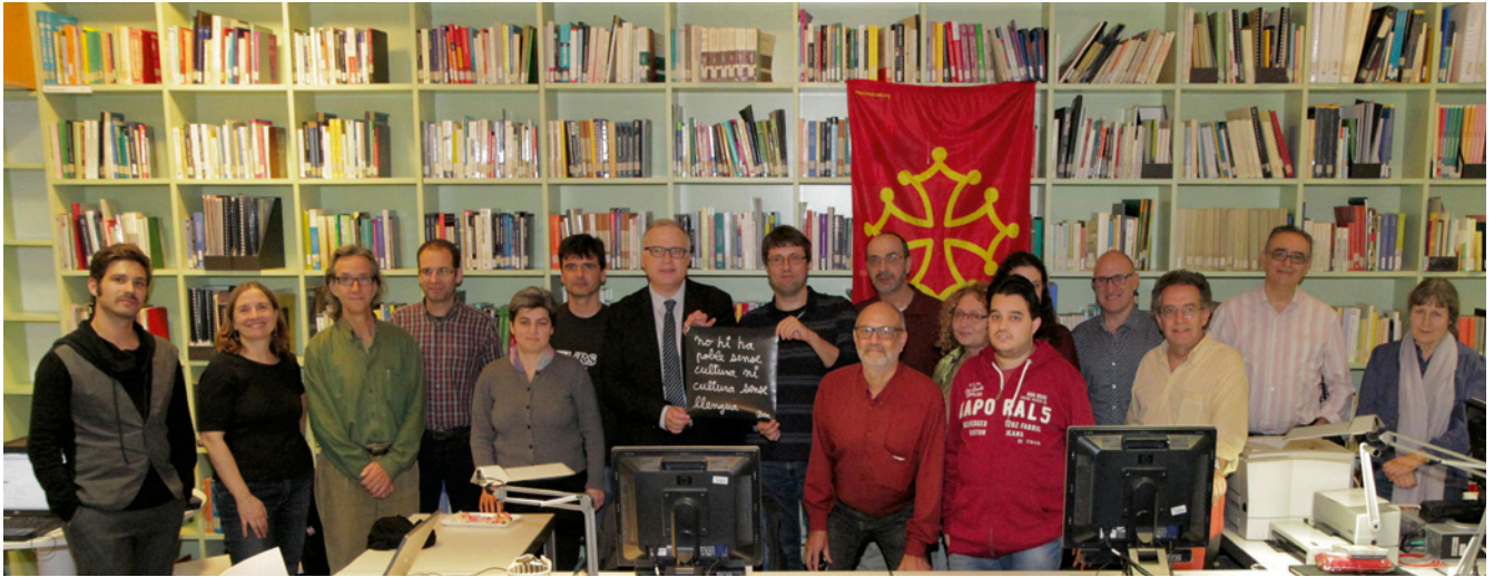
Participants en la III Nuèch de la Lengua dins l'Encastre Digital a Barcelona