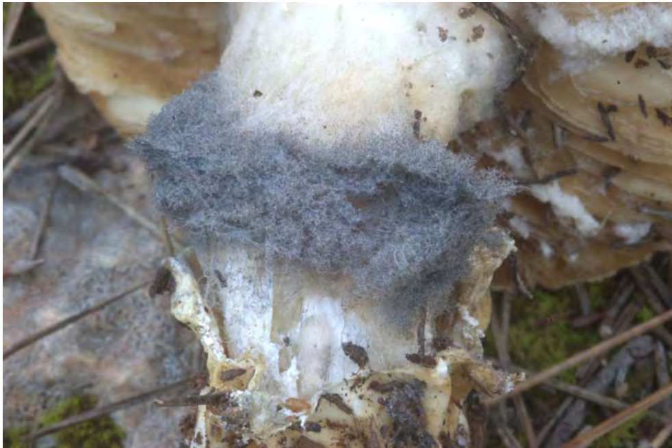
Syzygites megalocarpus Ehrenberg: Fr. sobre Amanita ovoidea