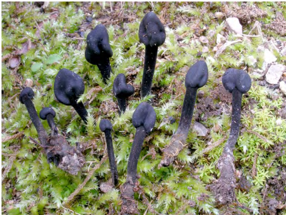
Trichoglossum walteri (Berk.) E.J. Durand