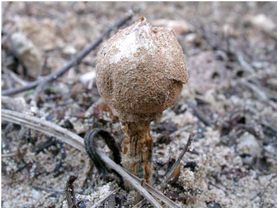
Schizostoma laceratum (Ehrenb.: Fr.) Lév.