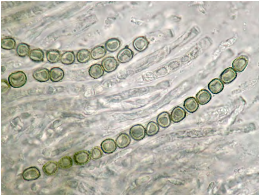
Ascs i ascòspores d' Hypocrea gelatinosa (Tode: Fr.) Fr.