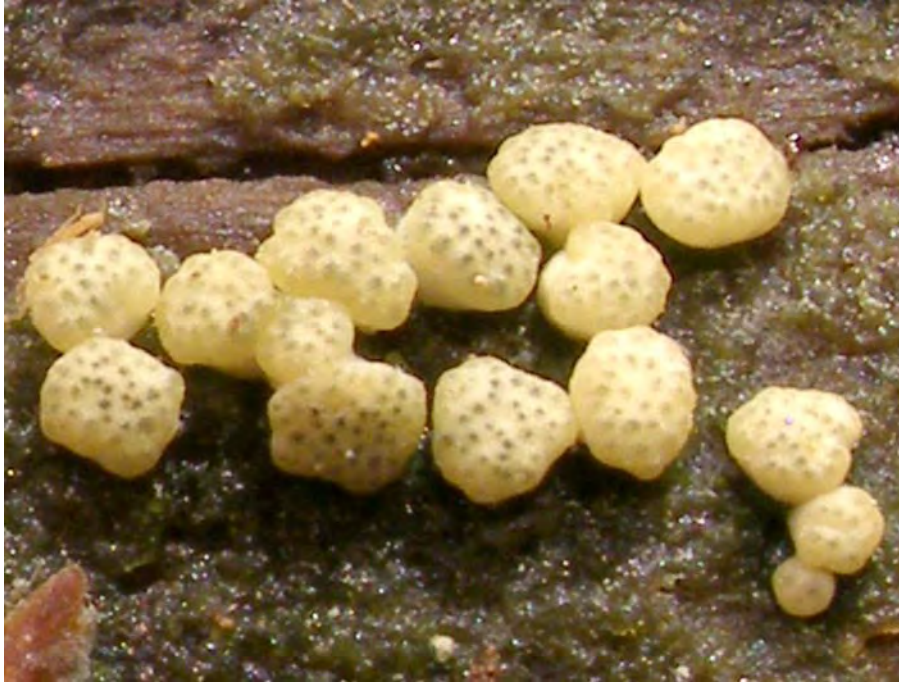
Hypocrea gelatinosa (Tode: Fr.) Fr.