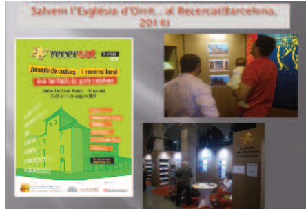
Imatges de la campanya "Salvem l'església d'Orrit" iniciada a les xarxes el 2014 per l'Associació Cultural de la Terreta