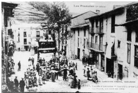
Festa del mai. Plaça de Sant Julià de Lòria, 1890. Les Pyrénées (3a Série), 1047 Labouche Frères, Toulouse