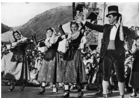
Dilluns de Festa Major 1956 a la Plaça. Postal Valls d'Andorra, Folklore d'Andorra. Ball de la Morratxa (Esbart de Sant Julià)

i la dansa folk. Tampoc no ho sé, però caldria pensar-hi.