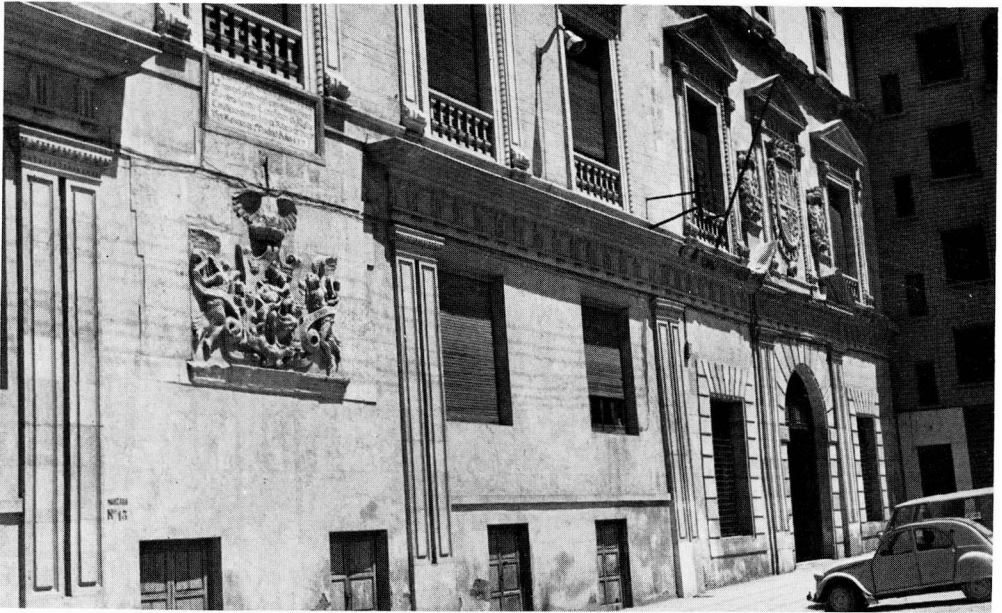
EL ALMUDÍ. L'edifici del segle XVI, avui destinat a seu de l'Audiència de Múrcia, és l'antiga quartera on s'ha fossilitzat un topònim urbà aràbic-català.