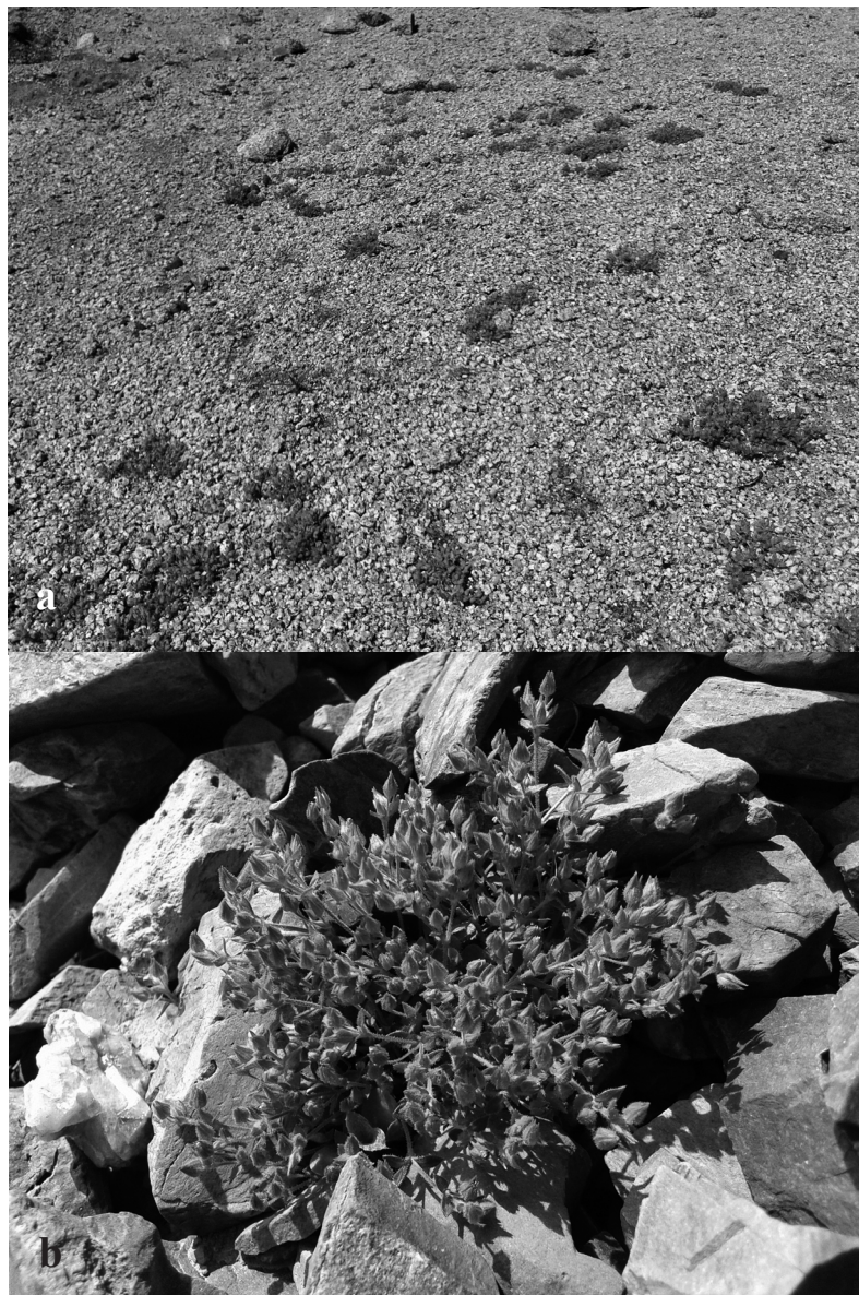
Figura 1. Hàbitat d' Arenaria marschlinii : a) al pui de Linya sobre granit molt descompost; b) detall d'un individu en una tartera esquistosa entre el Bony de les Picardes i el Clot de les Picardes.

31TDG3794, 2440 m, tartera esquistosa, 21-VII-2014, X. Oliver; coll de la Coma de l'Orri, Setcases, 31TDG3795, 2480 m, tartera esquistosa, 21-VII-2014, X. Oliver; puig Pastuira, Setcases, 31TDG4092, 2300 m, clapissars d'esquistos, 25-VII-2014, X. Oliver; entre coll de la Marrana i Bastiments, Setcases, 31TDG3796, 2573 m, tartera esquistosa, 27-VII-2014, X. Oliver; canals de Camamilla, sota portella de Morens, Setcases, 31TDG4097, 2350 m, tartera esquistosa, 27-VII-2014, X. Oliver; serrat de la Coma Clot, Queralbs, 31TDG3294, 2525-2675 m, clapissars d'esquistos 11 i 17-VIII-2014, M. Alabau; Fontnegre, Queralbs, 31TDG3294, 2530-2670 m, clapissars d'esquistos al voltant del camí, 27-VIII-2014, M. Alabau; coma de la Llebrada, Queralbs, 31TDG2996, 2495-2730 m, tartera esquistosa, 28-VIII-2014, M. Alabau; coll d'Eina, Queralbs, 31TDG3294, 2580-2.640 m, tartera esquistosa 22-VIII-2014, M. Alabau; sota la carena del Puig de