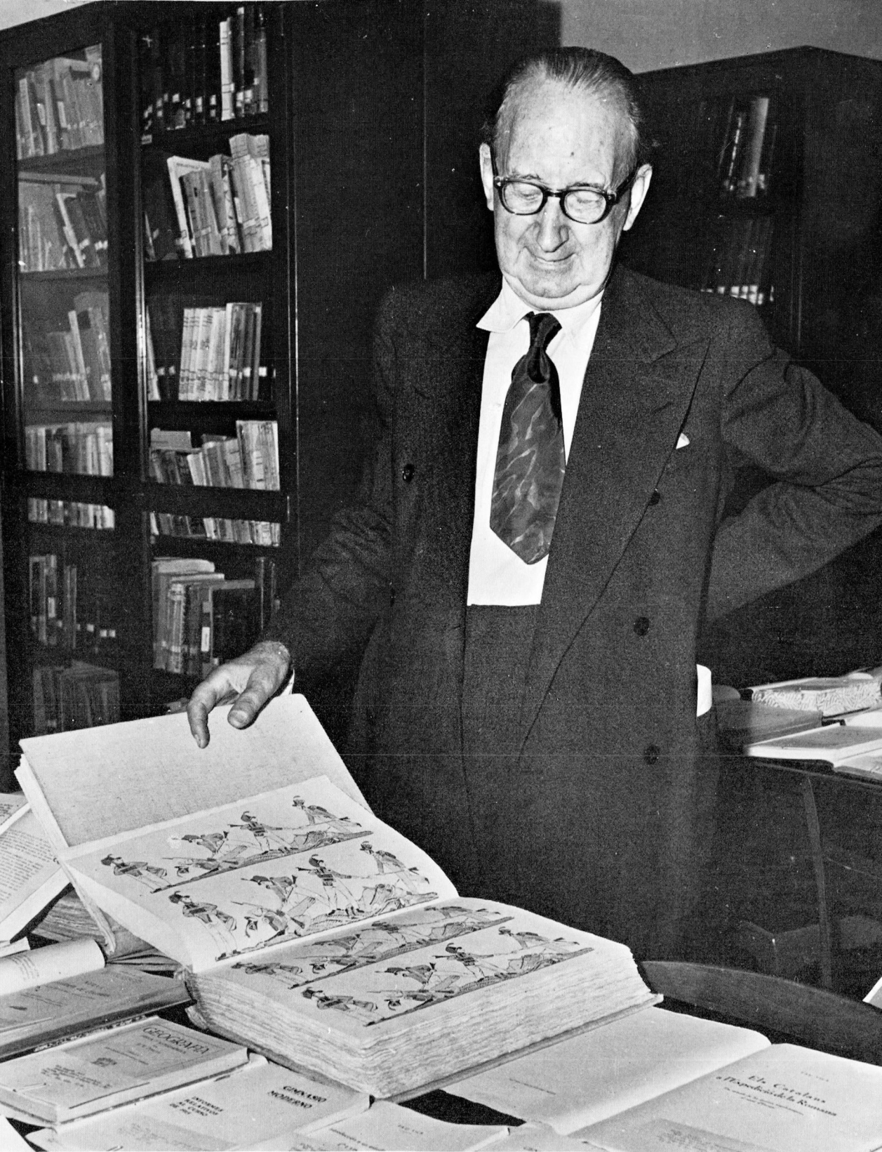
Caracas, 27-XI-1956. A l'Institut Pedagògic, mostrant la producció pròpia després del seu parlament.