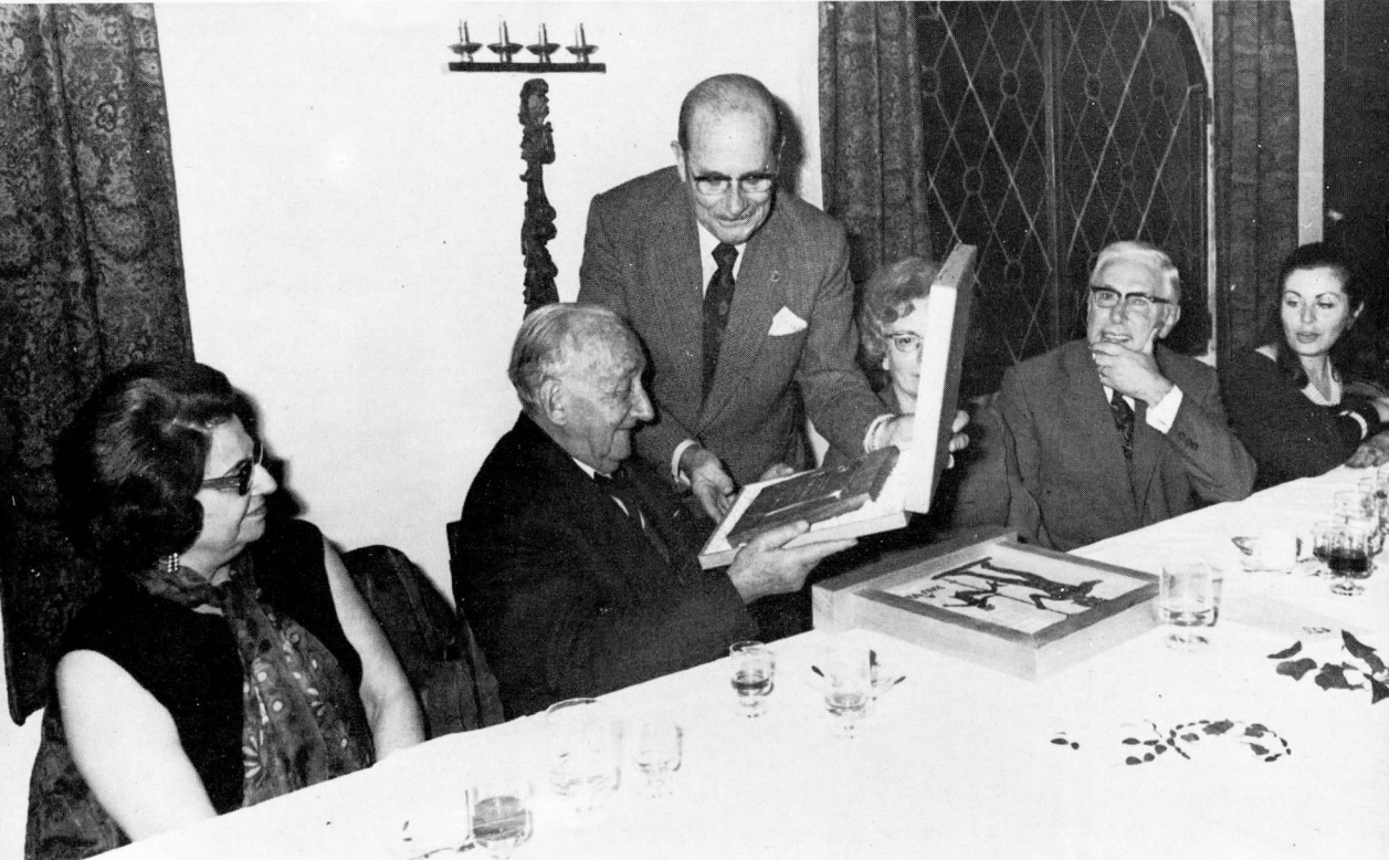
13 novembre 1971. Sòpar d'homenatge a Sabadell, i entrega de la placa al seu fill il·lustre.