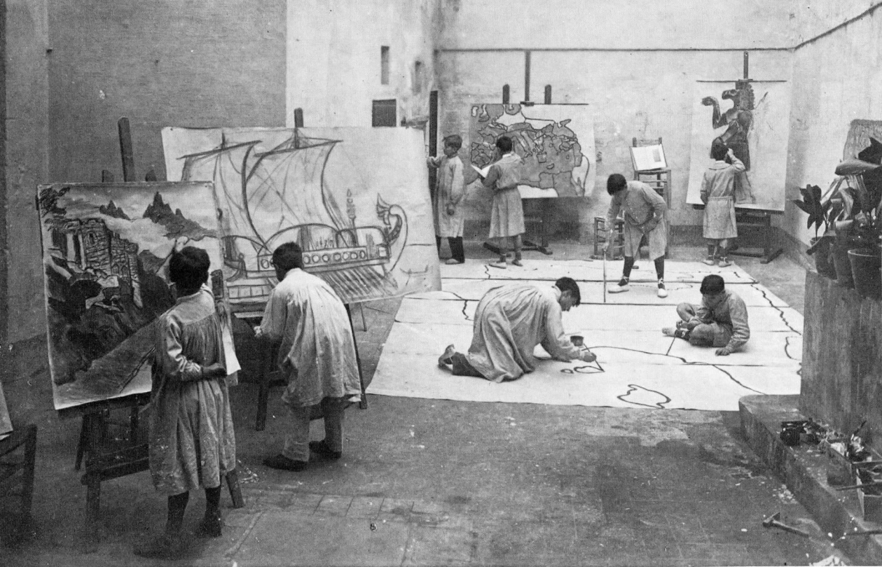
Any 1910. A l'Escola Horaciana els alumnes preparen en el pati, a les hores lliures, el material mural per l'ensenyança.