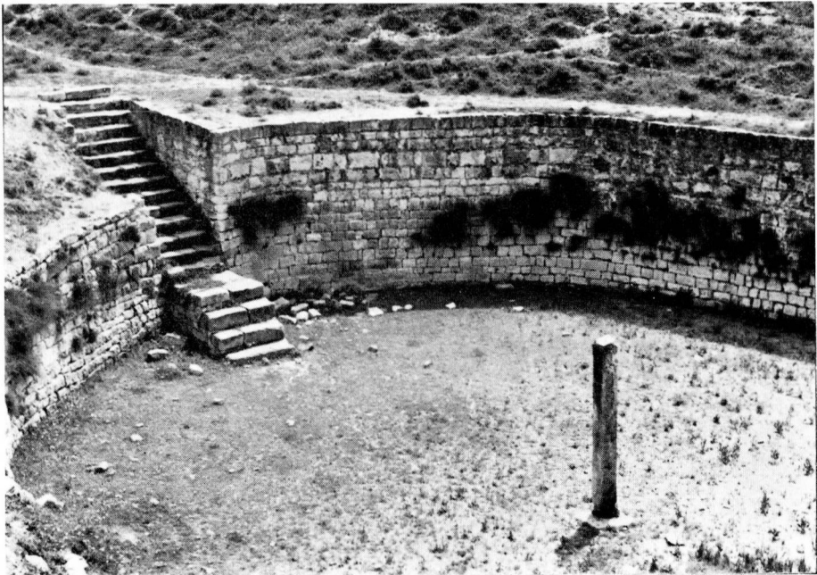
Almatret: La bassa de pedra.