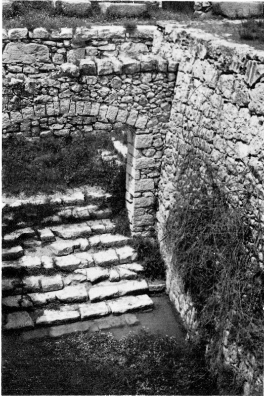
Almatret: Aspectes de l'Aljub.