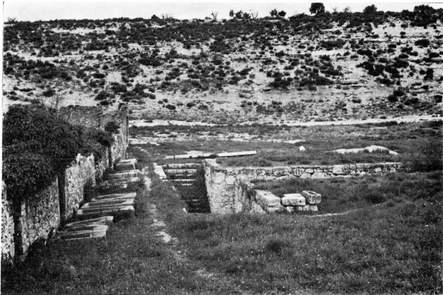
L'Aljub d'Almatret servia també pels abeuradors del bestiar. Hom en veu uns quants entre les escales d'accés i la paret que dona a l'horta.