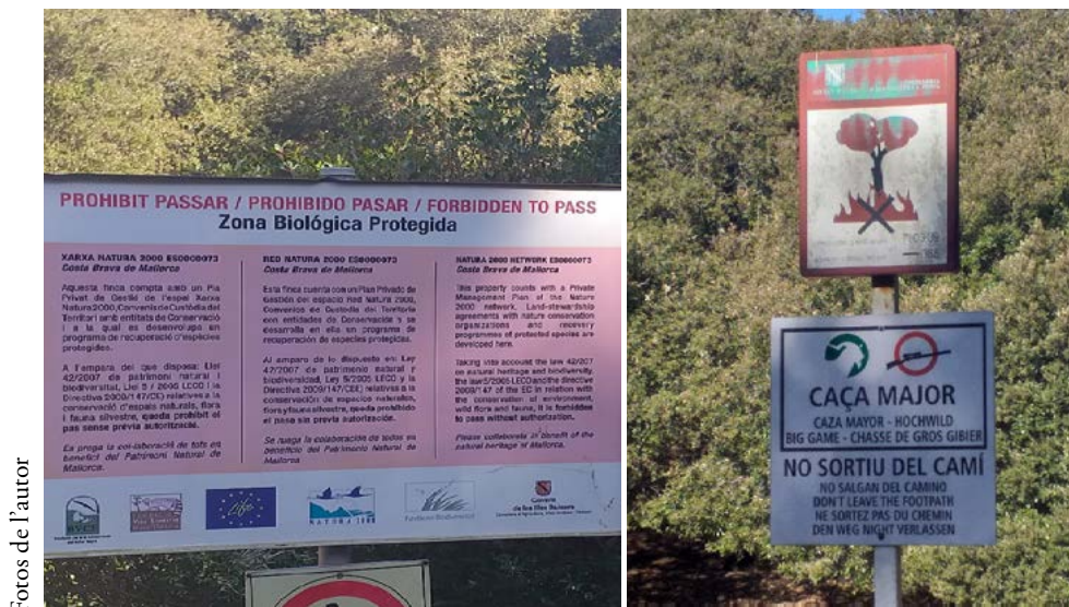
Figura 3. Una reserva segregada