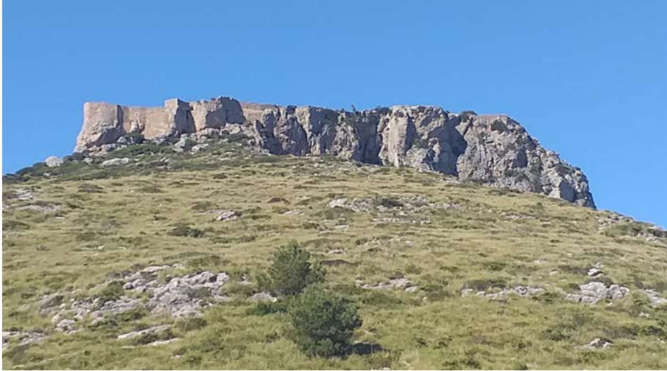
Figura 4. El castell de Pollença, zona de nidificació de voltors