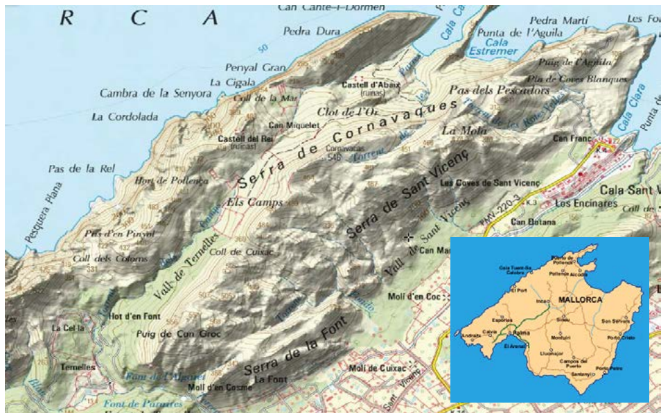
Figura 2. Mapa de l'àrea d'estudi de la vall de Ternelles dins la serra de Tramuntana entre els municipis de Pollença i Escorca