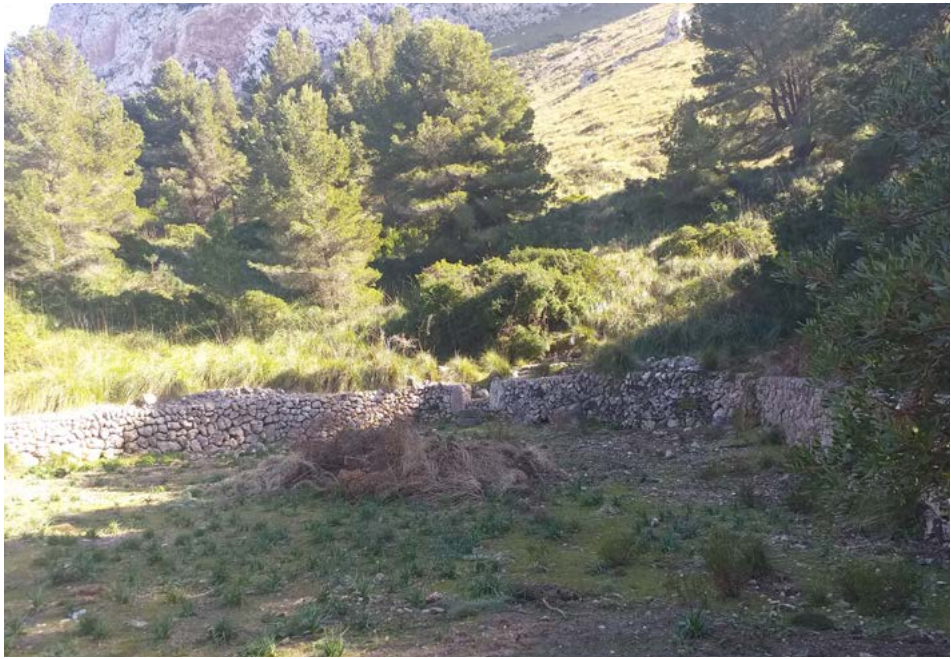
Figura 5. Coll Miquelet

talment desbrossat i part dels murs es troben en total d'abandó. Alhora també el Castell del Rei, tot i la seva rellevància comença a patir el mateix procés de degradació per culpa de la restricció d'accés però sobretot per la prioritització de la nidificació sobre l'interès cultural, malgrat les protestes creixents davant les administracions.