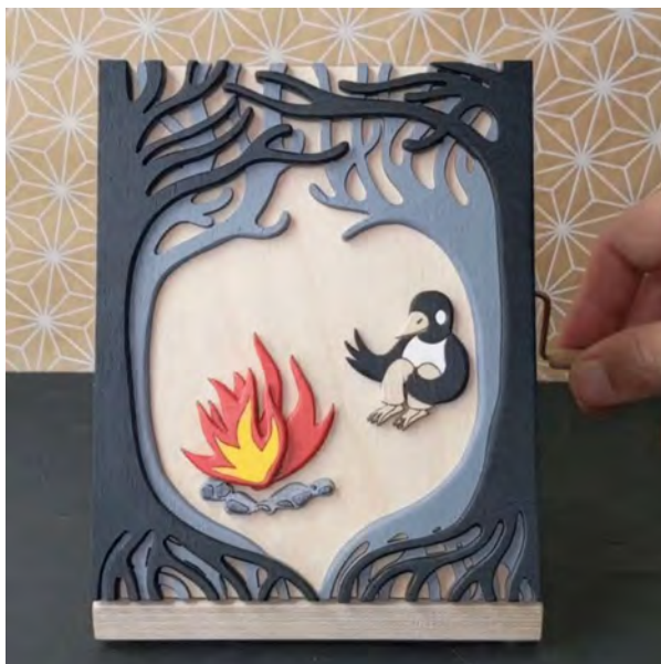
FIGURA 1. Magpie hollow , obra feta per al Deep Forest Show del 2020. FONT: https://wolfcatworkshop.com/index.php/portfolio/kinetic-works/ .