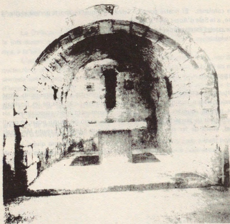
Capella de Sant Salvador de can Boquet. Absis interior

Can Boquet és a dalt la carena de la serralada de la Costa del Maresme, no gaire lluny de Sant Mateu i ben a prop del dolmen de Can Boquet —la Roca d'En Toni—. Pertany a Vilassar de Dalt i és una de les millors masies del Maresme, amb una àmplia visió panoràmica sobre Vilassar, als seus peus, i una munió de pobles de la comarca i un mar immens.